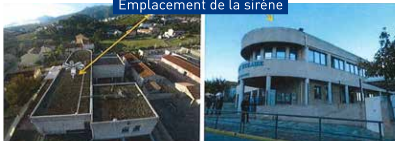
Emplacement de la sirène

En cas de risque réel, le message sera différent et émis plus fort.